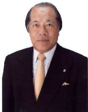
取締役会長・税理士 認定登録 医業経営コンサルタント