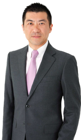
代表取締役社長・税理士 認定登録 医業経営コンサルタント