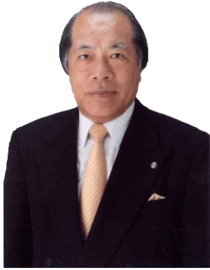
代表取締役会長・税理士 認定登録 医業経営コンサルタント